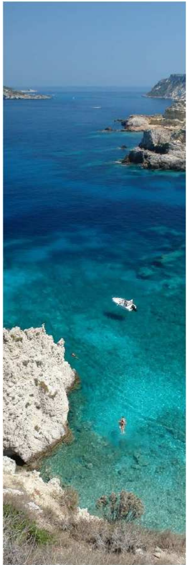
Il mare delle Isole Tremiti

Non scordatevi poi la macchina fotografica e un buon libro, ottimo compagno per gustare i momenti di silenzio durante la sosta in qualche cala.