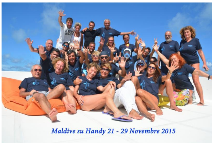
Maldive su Handy 21 - 29 Novembre 2015